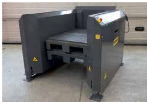
PALOMAT® a medida para palets de 1060x750x175 mm

Empresas como Grundfos, Carlsberg, Coca Cola, Volvo, Nestlé, Chanel, Haribo, Pfizer, Siemens y Miele ya tienen instalados varios PALOMAT®, consiguiendo un flujo de palets mas eficiente.