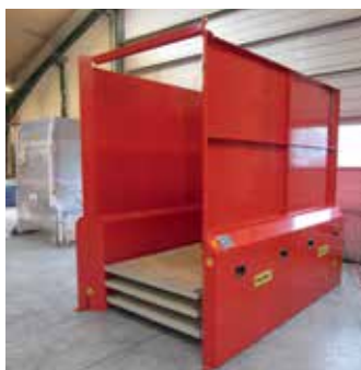
PALOMAT® a medida para plataformas de 2400x1200x160 mm