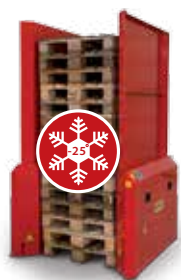
Manipulación de palets en ambientes fríos hasta -25 °C

(solo versión Greenline 100% eléctricos)