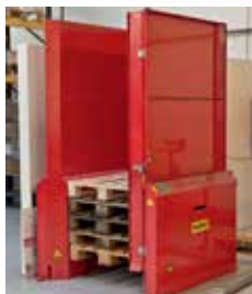
Estructura de seguridad para 15 palets con puerta

- adaptadas completamente a sus necesidades