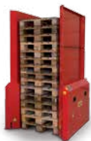
Estructura de seguridad para 15 palets