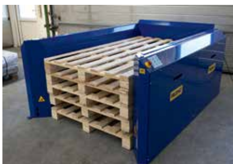
PALOMAT® a medida para palets de 2015x900x137 mm

Contacte con su distribuidor y solicite un PALOMAT® que se adapte exactamente a su flujo de palets.