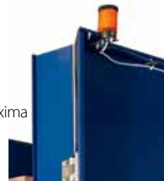
Señal luminosa con indicador de altura máxima