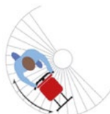
Scala chiocciola Spiral staircase