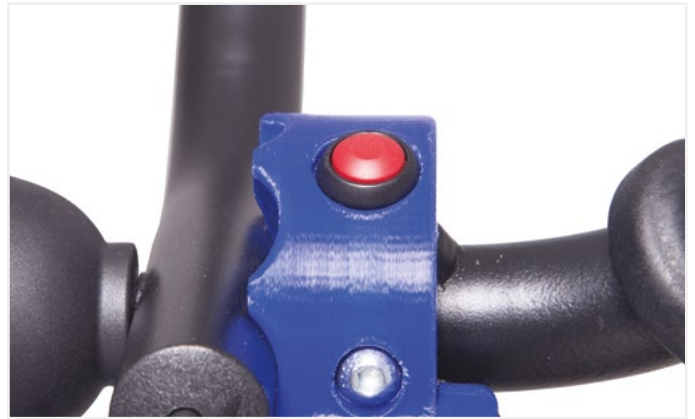
■ Botón de movimiento del cuerpo de la máquina / Base equipment movement button

Botón de inicio hacia arriba y hacia abajo para operar la máquina cuando la barra de tiro está doblada y subir el último escalón más fácilmente