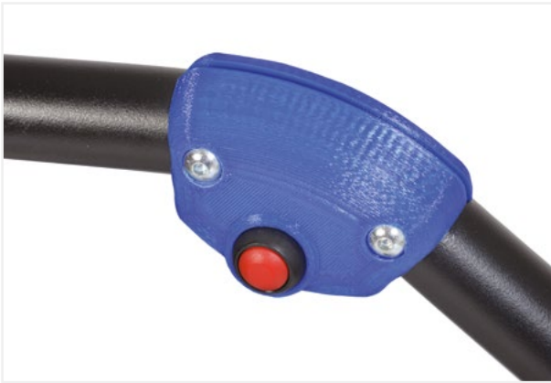
■ Pulsador de movimiento en la barra de agarre / Drawbar movement button