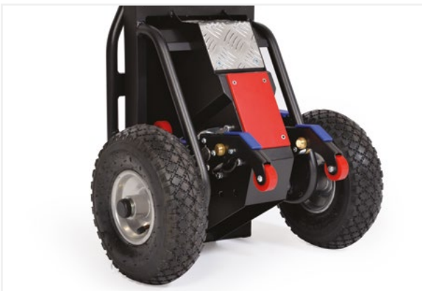
■ Palanca de levación / Lifting levers

Sistema que permite subir y bajar la máquina eléctricamente. Las palancas aumentan la seguridad y la facilidad de uso, gracias al reconocimiento del borde del escalón. / Sistema para mover eléctricamente la máquina hacia arriba y hacia abajo. Las palancas de detección de bordes de escaleras garantizan una mayor seguridad y facilidad de uso.