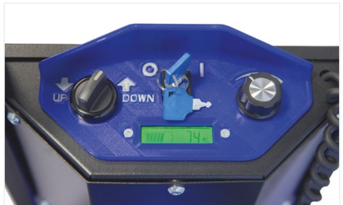
■ Quadro comandi / Control panel

Sistema que permite subir y bajar la máquina eléctricamente. Las palancas aumentan la seguridad y la facilidad de uso, gracias al reconocimiento del borde del escalón. / Sistema para mover eléctricamente la máquina hacia arriba y hacia abajo. Las palancas de detección de bordes de escaleras garantizan una mayor seguridad y facilidad de uso.