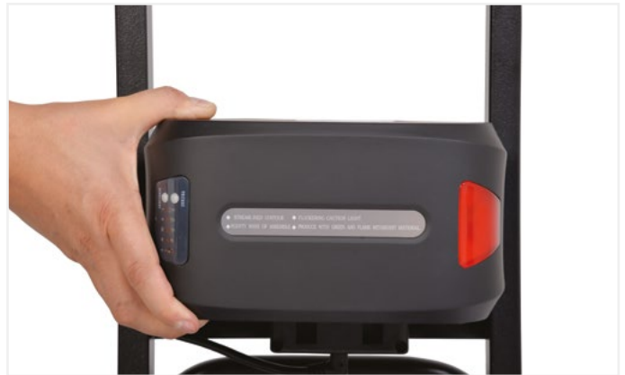
■ Batería de litio extraíble 24V - 13Ah / Removable 24V - 13Ah lithium battery

Cargador de coche que te permite cargar la batería del Donkey. Entrada 12VDC - salida 230VAC / 50Hz / Cargador de coche para cargar la batería Donkey.